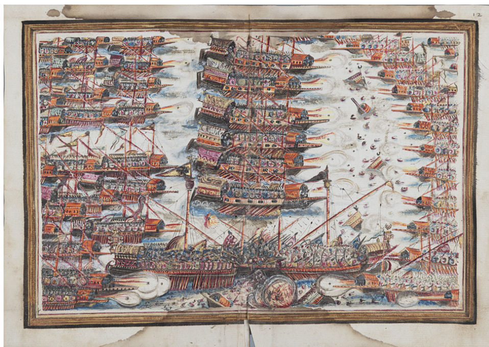
Fig. 1. Ilustración de la batalla de Lepanto en el manuscrito de Frutuoso de São João, Monumenta rerum memorabilium ab anno salutis MDLXIX , Ms. 716, Biblioteca Pública Municipal do Porto, fols. 12v-13r (reproducido con el permiso de la Biblioteca Pública Municipal do Porto)

Una riquísima literatura en Portugal en cambio está dedicada a la derrota de Alcácer-Alquibir, un desastre nacional que dejó a millares de cautivos portugueses que fueron liberados solo paulatinamente y muchos que nunca consiguieron salir del cautiverio del Magreb. Aparte de una abundante serie de textos dedicados al sebastianismo, la creencia en un rey escondido y no fallecido en la batalla que volverá, fuertemente imbuido de mesianismo hubo también una serie de textos compuestos por cautivos que lamentaron el fracaso de la fallida jornada de África. Existen composiciones poéticas como las Varias rimas do Bom Jesus (1594) de Diogo Bernardes (ca. 1530-1596), las composiciones poéticas y teatrales presentes en el Cancionero de Dona Maria Henriques atribuidas al emisario portugués encargado de redimir los cautivos para Felipe I Francisco da Costa (1533-1591) y varias colecciones misceláneas de composiciones poéticas que constituyen un corpus de textos con el rasgo especial de ser una producción escrita desde el cautiverio de Marruecos después del desastre de la batalla de los tres reyes 19 .