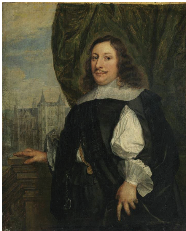
Fig. 1. Retrato de David Teniers, el Joven, Pieter Thijs, 1659. Staatsgalerie im Neuen Schloss, Schleissheim

David Teniers el Joven (1610-1690) fue quizá el artista flamenco más activo de la generación que sucedió a Pieter Paul Rubens (1577-1640) y no exageramos al afirmar que llegó a ser el gran pintor de género del siglo xvii 9 [Fig. 1]. Nacido en Amberes en 1610, se había instalado en Bruselas en 1650, y un año después fue nombrado pintor de cámara del archiduque Leopoldo Guillermo, en sustitución de Van den Hoeck. En 1656, tras la marcha del archiduque a Viena, siguió en el mismo cargo con don Juan José de Austria 10 . Aunque se ha señalado que tras la salida de este último sus ambiciones pudieron verse frustradas, Teniers continuó siendo beneficiario del mecenazgo de los gobernantes de Flandes, como Luis de Benavides, marqués de Frómista y Caracena, aun cuando en el caso ya eran gentilhombres y no príncipes de sangre 11 . Incluso, recientemente, nueva documentación demuestra su labor como conservador y restaurador de la colección real de Bruselas, entre Tervueren y Coudenberg 12 .