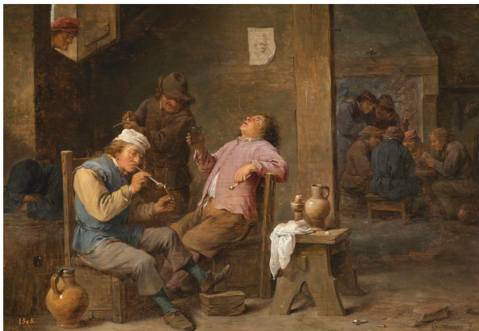
Fig. 3. Fumadores y bebedores , David Teniers, II, óleo sobre tabla, 34 x 48 cm, 1652. Museo Nacional del Prado [P001794]

Como vemos, este género de pintura causó una gran sensación en el contexto de la Europa Barroca, al tratarse de escenas de la vida cotidiana, interiores domésticos o tabernas, en la que habitualmente individuos de clases populares fumaban, bebían, pelean o se mostraban sin disimulo [Fig. 3]. Los aspectos de la vida cotidiana fueron los objetivos de la complacencia de Teniers, ambientes que habían sido considerados anteriormente como indignos para un artista de su rango. De hecho, tanto Pacheco como Carducho habían afilado su pluma para definirla como pintura vulgar. No fueron de la misma opinión los ciudadanos flamencos a los que gustaba verse reflejados en actos y vida de las gentes humildes con gran riqueza de color y explosión de una alegre poética. Curiosos y amateurs acudían a la casa de Teniers para hacerse con las mejores pinturas de este género.